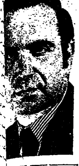
لقاء بريس حنا يسفر عن اقامة حلقة للتفاهم العربي اليهودي

الناصرة - لمراسلتنا - دعا وزير الصناعة والتجارة والسياحة السيد جددون بات الصناعيين العرب واصحاب رؤوس الاموال للمبادرة من اجل اقامة المصانع في الوسط العربي . وكان السيد بات يتحدث في اجتماع للصناعيين واصحاب رؤوس الاموال العرب واليهود عقد في بلدة كرمئيل .